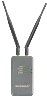
※写真は標準添付のアンテナと別売アンテナを取り付けています。