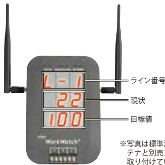
※写真は標準添付のアンテナと別売アンテナを取り付けています。